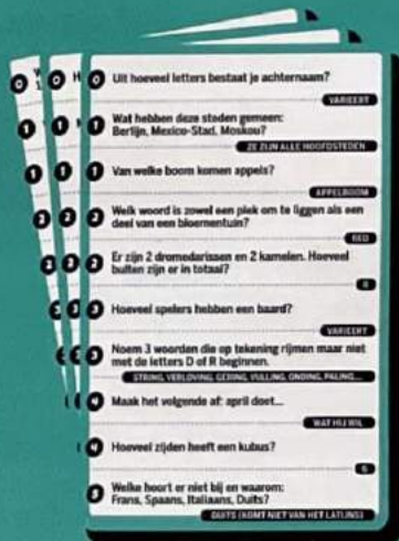
50 blauwgroene verbale kaarten (1.000 vragen)